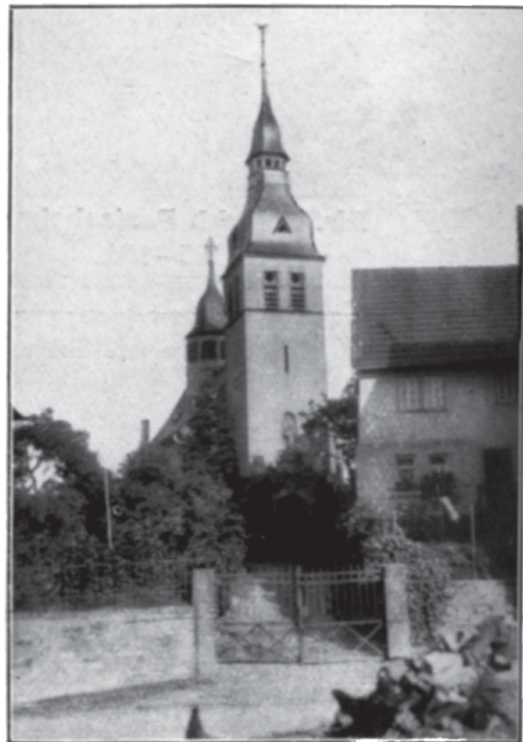
Die Seibersbacher Kirche rechts angebl. das 1. Pfarrhaus 1703 - 1715