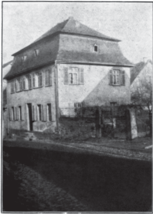
Das alte Pfarrhaus erbaut 1791