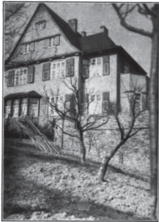
Das neue Pfarrhaus 1916 - 1920