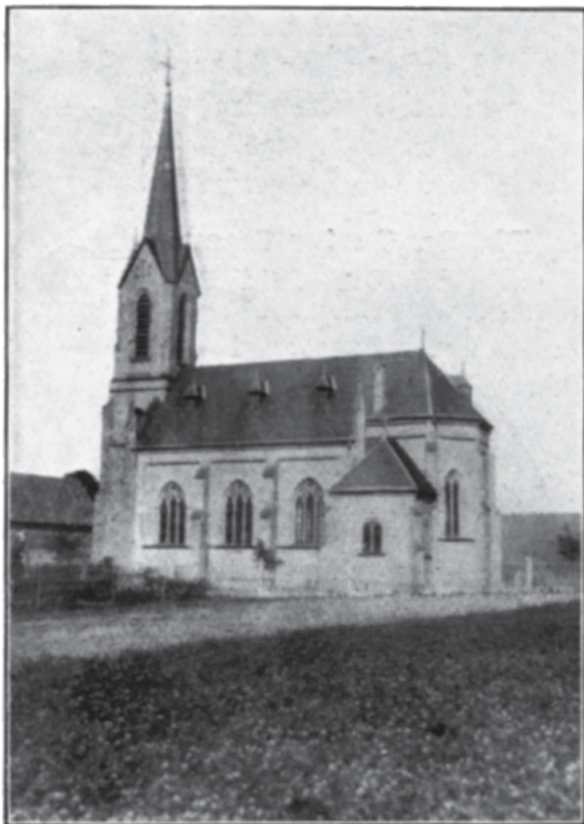
Die Dörrebacher Kirche eingeweiht 1900